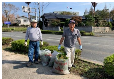
恩田地区老人クラブ連合会 全国一斉清掃の日9/20(日)

* 今回の避難所開設に関して、多々反省点があり、今後緊急時の体制・地区独自の備蓄品等検討します。ランタン、電池、ポット、養生テープ等役立ちました。