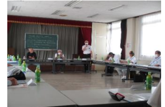
三原恩田小学校校長