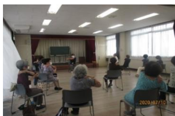
まちづくりサークル風景 (恩田ふれあいセンターにて)